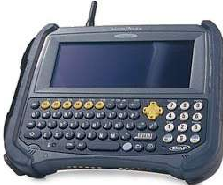
Figure 2 : terminal mobile à bord d'une voiture de police recevant des instructions provenant d'un système de CAD par radio UHF