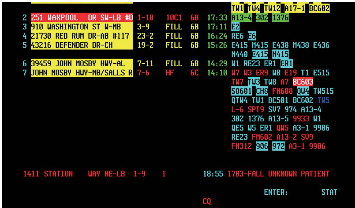
Figure 1 : écran de système de CAD utilisé par un assistant de centre de contrôle pour envoyer plusieurs camions de pompiers

Depuis l'introduction du numéro d'urgence (emergency number) "999" en 1937, de nombreux pays ont mis leurs services d'urgence à disposition du public par le biais d'un numéro de téléphone national. Les appels à ces numéros d'urgence sont acheminés à un centre d'appels connu sous le nom de Centre de régulation (ECC – Emergency Control Centre) dans lequel un personnel formé répond aux appels et envoient les équipes de secours appropriées. Bien souvent, les opérateurs utilisent des systèmes de Répartition assistée par ordinateur (CAD – Computer Aided Dispatch) pour coordonner le détournement de la police, des pompiers et des ambulances vers le lieu de l'urgence. La CAD est un système essentiel à la sécurité (safety-critical) et en temps réel (real-time) qui ne doit subir aucune interruption ( zero downtime ). Autrement dit, des vies peuvent être menacées si le système de CAD est indisponible ou lent, s'il ne fonctionne pas correctement ou si ses données sont erronées.