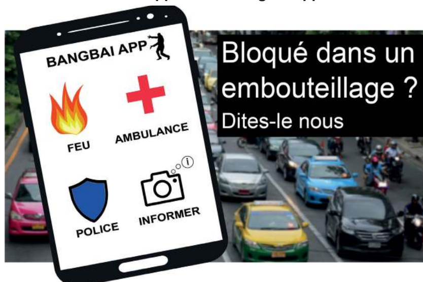
Figure 4 : exemple de poster de promotion de la fonction « Informer » de l'application Bangbai App

L'application, à l'instar d'un EMIS, pourrait également réduire les risques, c'est-à-dire anticiper les problèmes et agir avant qu'ils deviennent sérieux. En plus d'appeler les services 105 d'urgence, l'application mobile permettrait aux citoyens de signaler les problèmes non urgents : embouteillages, activités suspectes, risques pour la sécurité et la santé publique, ou même suggestions d'amélioration des services.